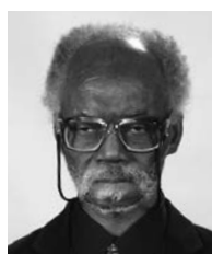
VALENTIN-YVES MUDIMBE Universitaire, poète, romancier, essayiste Docteur ès lettres honoris causa