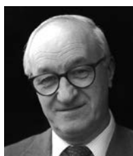
ALBERT BANDURA Psychologue canadien Docteur en psychologie honoris causa