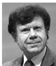
ROGER CHARTIER Professeur au Collège de France et directeur de recherche à l'École des Hautes études en sciences sociales (EHESS, Paris) Docteur ès lettres honoris causa