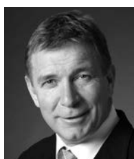
RICK M. HANSEN Athlète et président et chef de la direction de la Fondation Rick Hansen Docteur d'université honoris causa