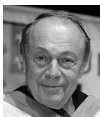
MICHEL ROCARD Homme politique français et écrivain Docteur d'université honoris causa