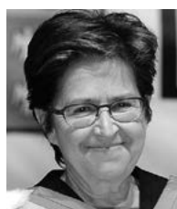
LORRAINE VAILLANCOURT Pianiste, chef d'orchestre et professeure titulaire à la Faculté de musique de l'Université de Montréal Docteur en musique honoris causa